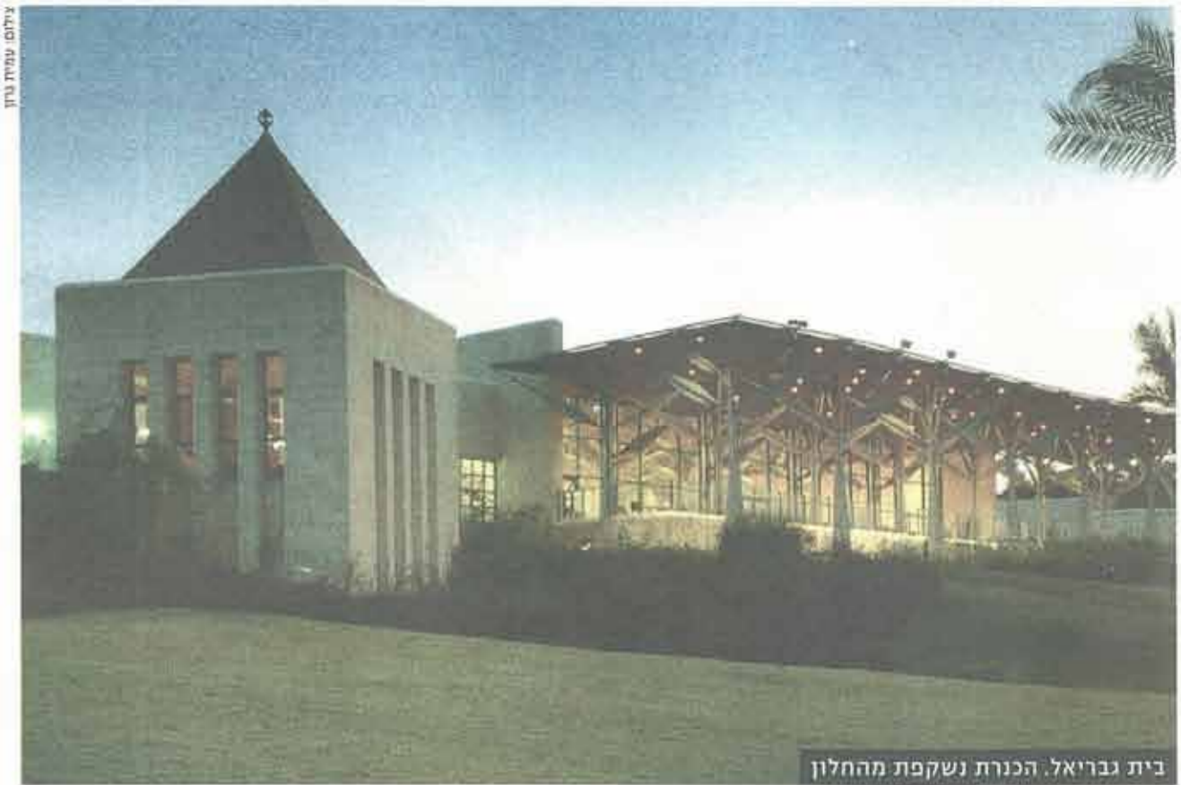
בית גבריאל. הכנרת נשקפת מהחלון

את הירע שצבר מימש עם תום לימודיו כשהשתתף בת' חרות בינלאומית לתכנון מקדש ופסל לבודהה בניו דלהי, לציון 2,500 שנה לבודהיזם. מתוך קרוב ל-6,000 אדריכלים שהשתתפו בתחרות זכה בפרס הראשון אדריכל הודי ("משרי קולים פולייטיים") ובמקום השני פלסנר. בסופו של דבר