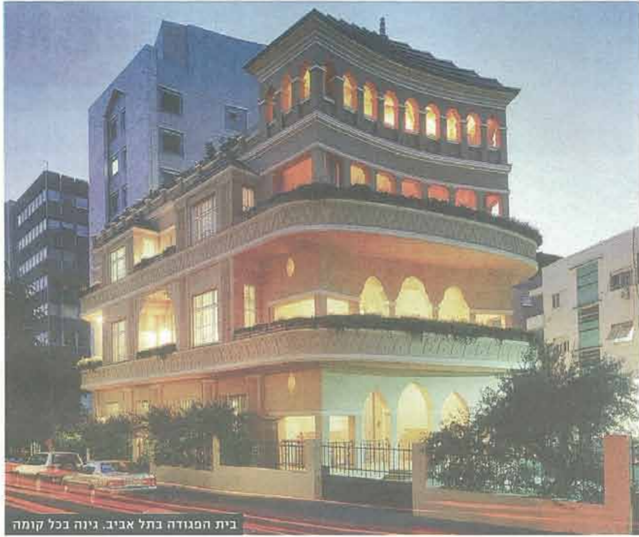
בית המגודה בתל אביב. גינה בכל קומה