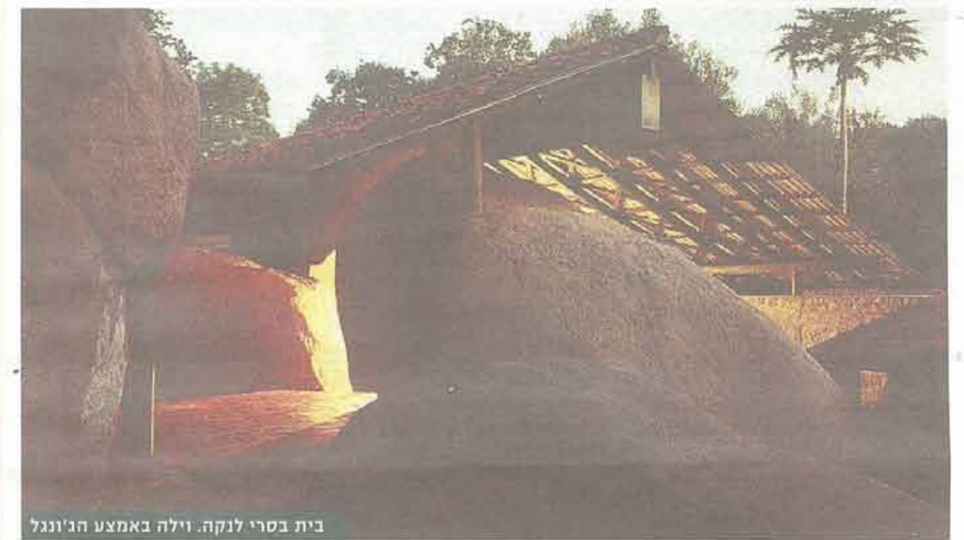
בית בסרי לנקה. וילה באמצע הג'ונגל

לגובה. כשאוטרט אמר שחייבים לבנות לגובה בירושלים היה מרובר לטעמי במיתוס מוחלט. זו טעות גדולה. טעות נוספת בירושלים נוגעת לכל המושבים מסביבה שמתפ"ר רשים בחוסר אחיזת מהלטה והורסים את כל הנוף סביבם. ישנן טרסות נפלאות וקלאסיות באזורים האלה. זה נוף מאוד עדין שבניין מבוזר אחד מהריב לגמרי".