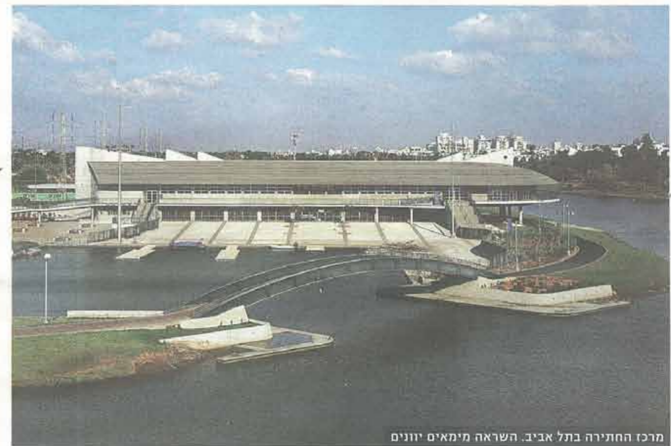
מרכז החתירה בתל אביב. השראה מימאים יוונים