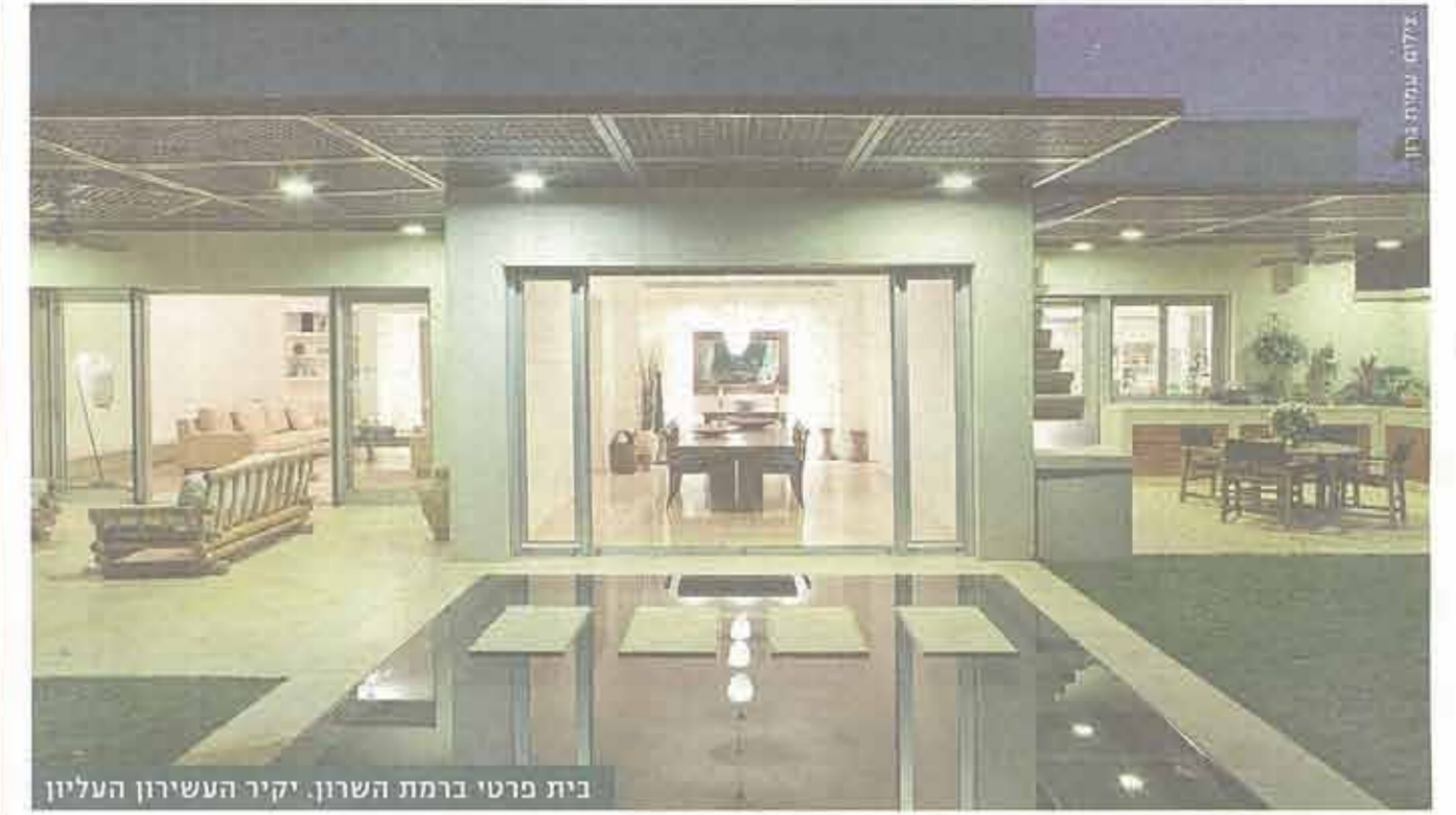
בית פרטי ברמת השרון. יקיר העשירון העליון

מאז מתחלקת עבודתו של פלסטר וארבעת שתפיו הצ"ע ירדים בין בתים פרטיים (שחזור בית הפגודה בתל אביב ותכנון בתים רבים בסביון, כפר שמריהו, רמת דויל ושרה ורבורג) ובין מבני ציבור. אחד הפרויקטים הציבוריים הוא קמפוס כפרי מדרום לקולומבו בירת סרי לנקה, שמתוכנן בשיתוף פעולה עם הג'וינט למען נפגעי צונאמי. הפרויקט מאפשר לפלסטר לשוב למקום שנראה כאהוב עליו ביותר: "מסרי לנקה אני לא מרפה", הוא מודיע. *